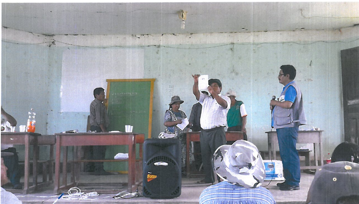
Cómputo de votos frente a la atenta mirada del representante del Tribunal Electoral Departamental de La Paz