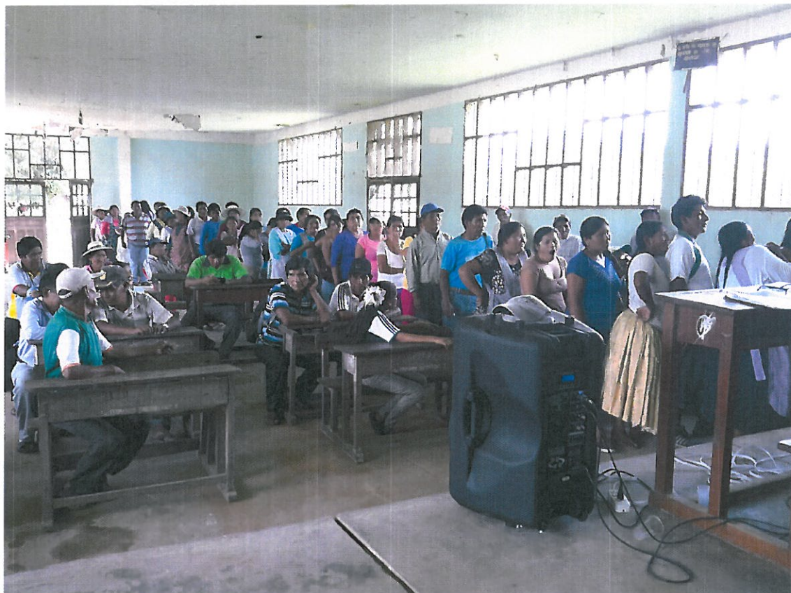
Asistentes hacen fila para firmar el libro de acta