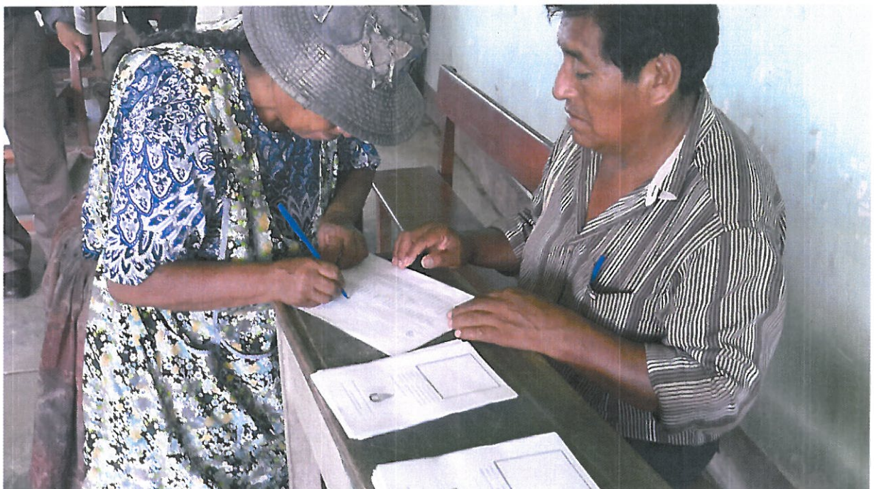
Jurada electoral emite su voto