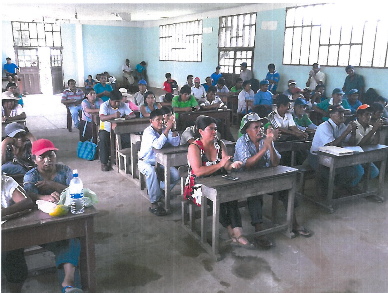
Electores y electoras de San Miguel de Huachi