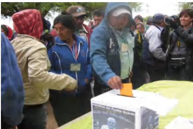
Delegados acreditados depositando su papeleta electoral a las ánforas.