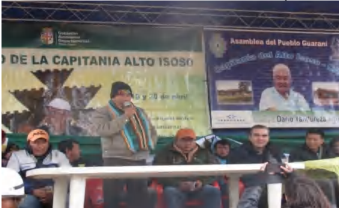
Inauguración de las elecciones de la Zona Alto Isoso