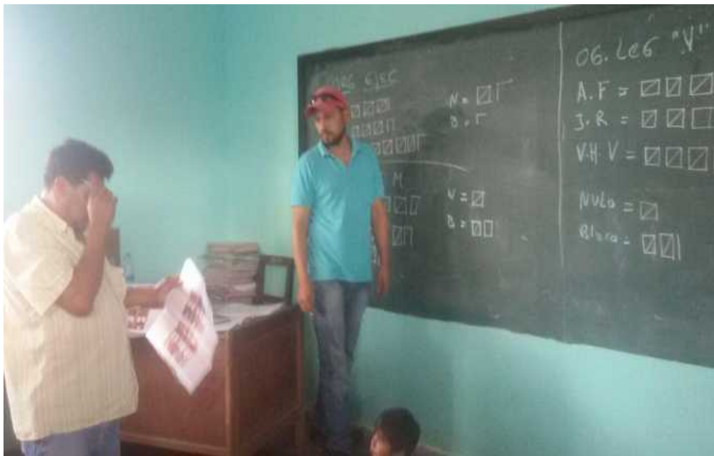
Conteo de votos.