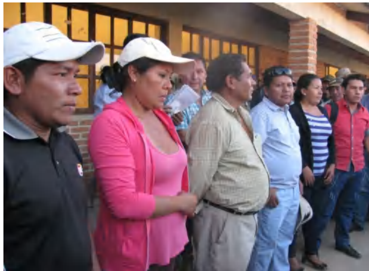
Presentación a las bases de los candidatos/as electos por la zona Bajo Isoso.