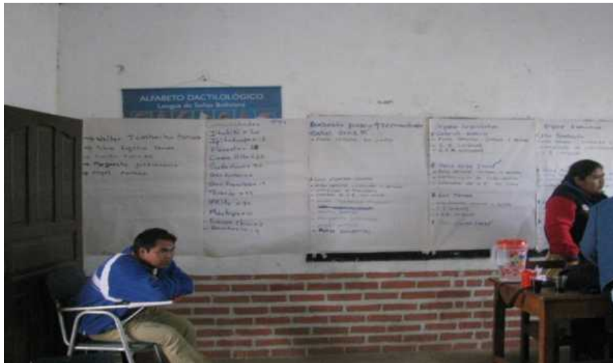
Proceso de acreditación de los delegados por las autoridades comunales (29 de agosto de 2016).