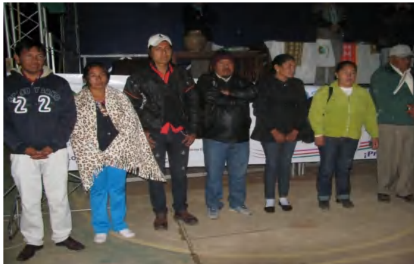
Foto 2.- Presentación de candidatos electos a todas las bases.