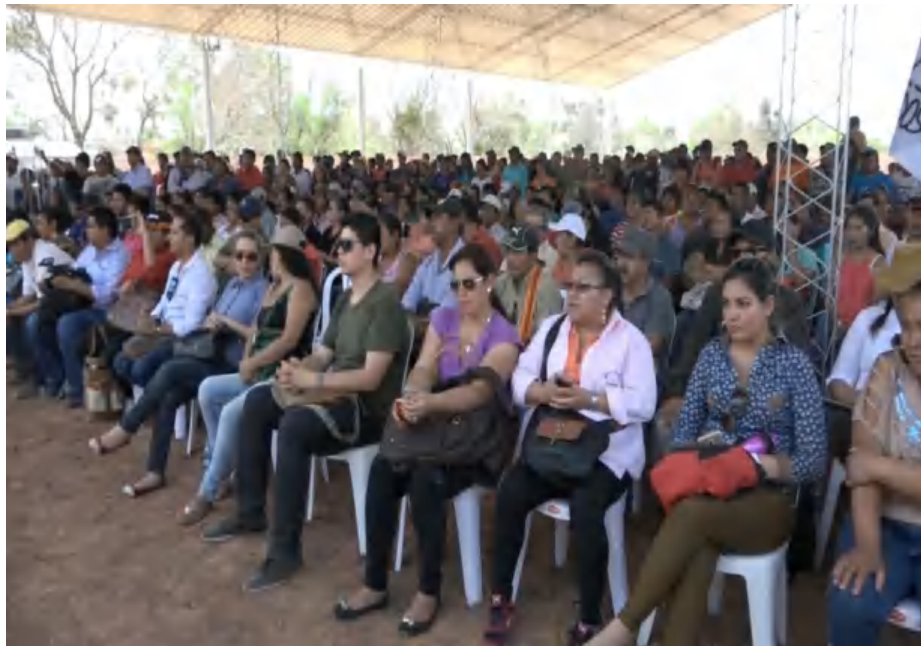
Foto 2.- Delegados de las asambleas comunales e invitados.