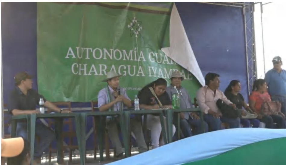
Foto 1.- Apertura del acto eleccionario