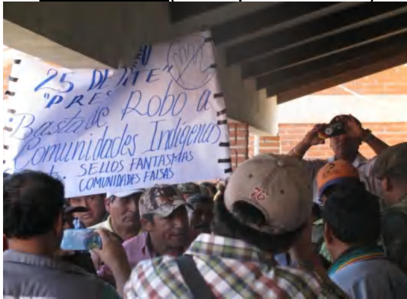
Presencia de la Comunidad 25 de Mayo, para que sean tomados en cuenta en el proceso eleccionario.