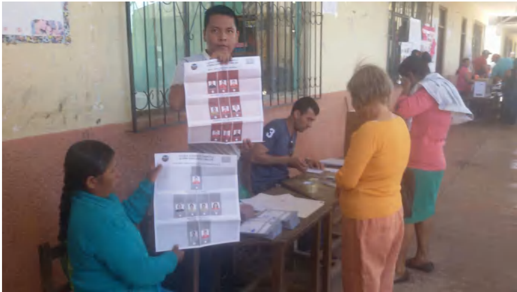
Revisión de la papeleta en blanco antes del escrutinio.