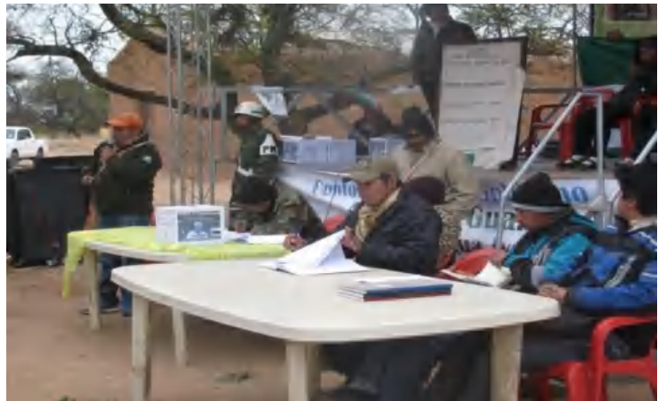
Ánforas para elección de sus autoridades.