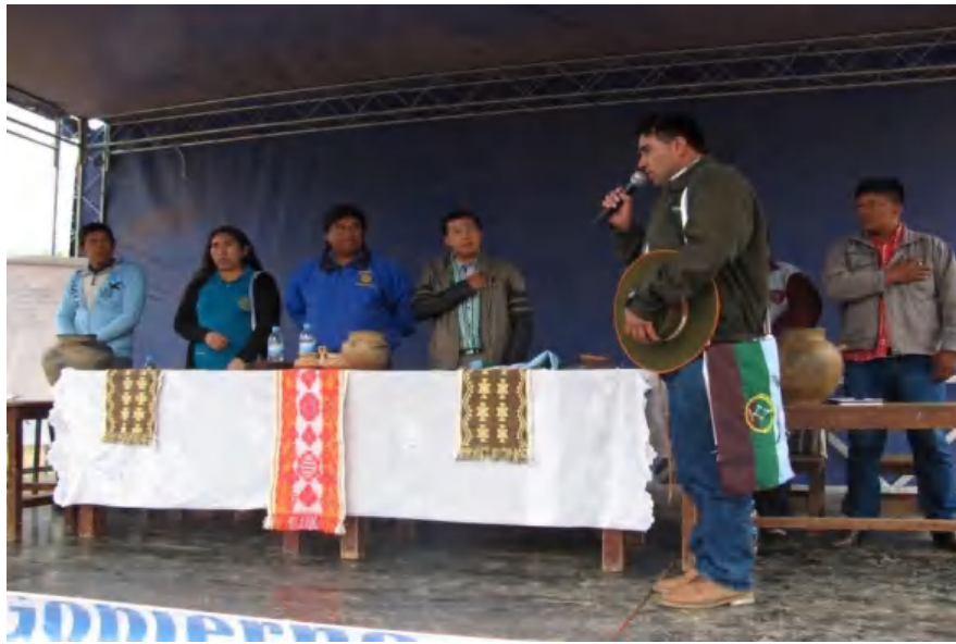
Foto 1.- Posesión de la Mesa Presídium de Charagua Norte.